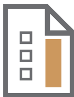
Bulletin de vote de couleur