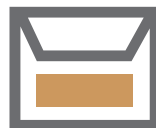
Petite enveloppe de couleur