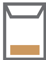
Enveloppe de taille moyenne de couleur